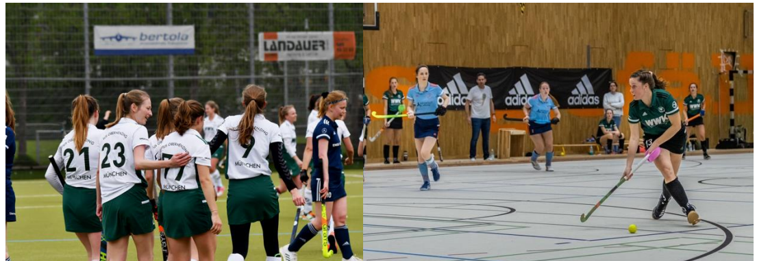
Kleiner Banner Feld/Halle